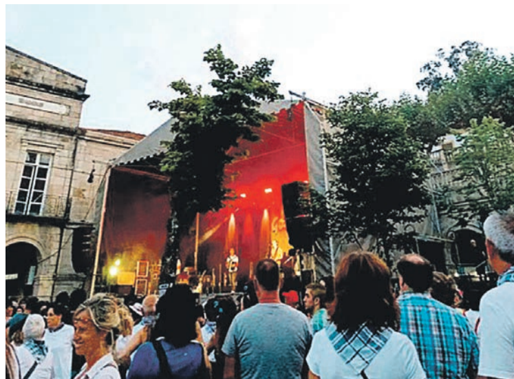
↑ Iaz txosnagunea jendez bete zein Gernikako jaien egun handienetan. TXOSNA BATZORDEA

Txosna batzordea «gero eta anitzagoa» bihurtzen ari dela azpimarratu dute, udalerriko «iritzi ezberdineko» eragileak bat egiten doazela, alegia. Aurten «pare