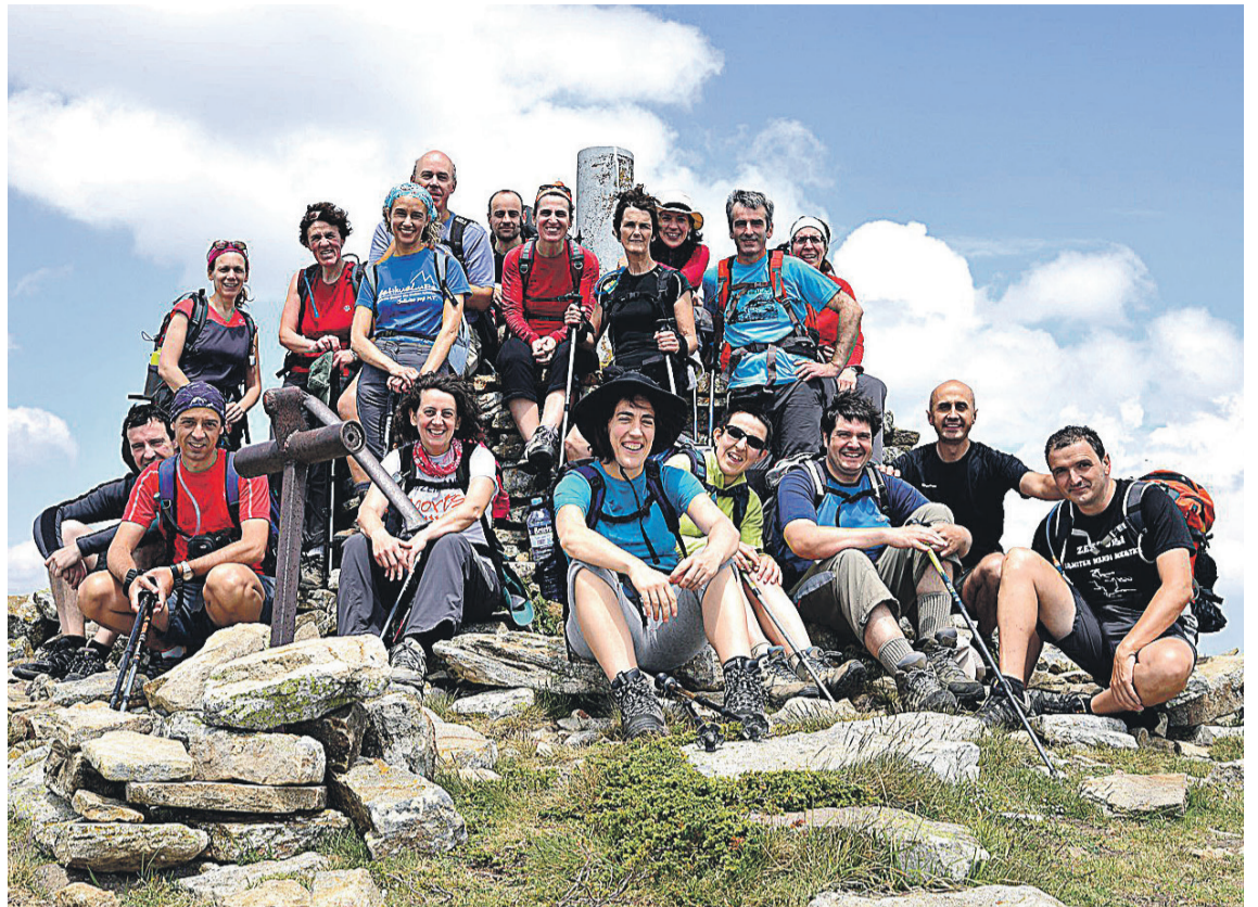
GOI ZALE MENDI TALDEA

Hala ere, errelebo falta da euren kezka nagusietakoa; txanda edo belaunaldi aldaketa hori etorriko ote den edo zelan etorriko den ez daukate argi. «Belaunaldi aldaketarik ez dago. Gazteenok 50 urte bueltan gaude. Uste dugu mendian ohiturak aldatu direla, eta oso orokorra dela elkarte askotan. Gazteagoak beste modu batera moldatzen eta mugitzen dira. Hemen taldean joateak dauka garrantzia, eta taldera moldatu behar da. Orduetegi bat daukagu, jatorduak elkarrekin egiten ditugu... hori da talde funtzionamendua». Taldean ibiltzearen abantailak azpimarratu dituzte, «aberasgarria» delako: «Abantaila handiak ditu, adibidez, autobusez joaten garenez, lekua batean