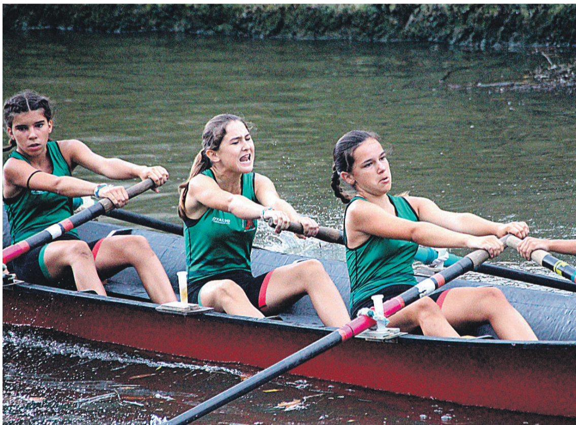
Elantxobe Arraun Elkarteko arraunlariak, iazko estropadan. MIKEL REINA BARROS

13:00. Trikitixa kalejira. 18:00. Puzgarriak. 20:00. Dj Alex & Jon.