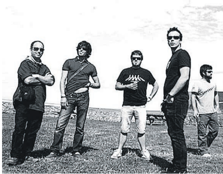
The Uski's taldeko kideak. THE USKI'S

Kontzertuak amaitu arren, musikak ez du etenik izango. Esne Beltzaren erreleboa Zirkinik Bez erromeriak hartuko du, eta ostean, DJ Elepuntoren txanda izango da. ●