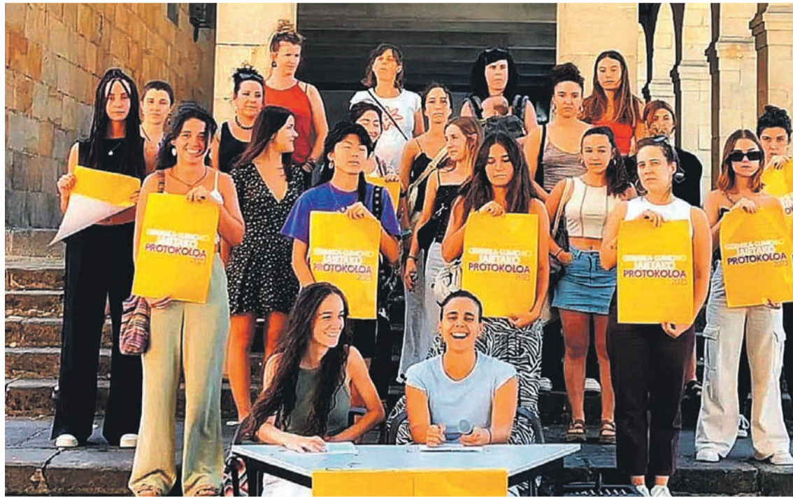
Erasoen aurkako protokoloa prestatu duten emakume taldeetako kideak. HITZA

Aurton, eraso jasan dutenek nora joan izan dezaten, udalak jarriko du erreferentziako leku bat. Puntu more bat ezarriko dute San Lorenzo zein Andra Mari eta San Roke jaietako eraso matxisten inguruan sentsibilizatzeko, informazioa emateko eta horiei erantzuteko: «Helburu nagusia da premiaz jardutea eta arreta pertsonala, jarraitua, espezializatua, integrala eta koordinatua ematea, genero indarkeriaren biktima direnei». Abuztuaren 10ean eta hilaren 14tik 17ra bitartean jarriko du informazio gunea: «Udalak informazio gune bat ja-