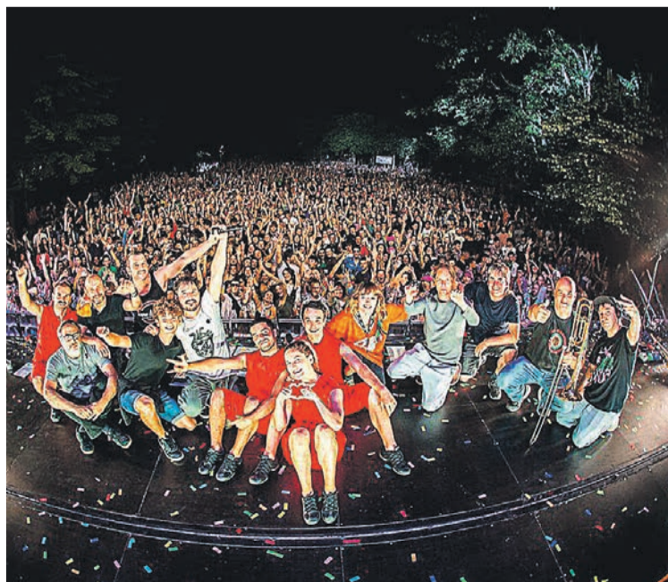
Esne Beltzako kideak uztailleko kontzertu batean. GAIZKA PEÑAFIEL