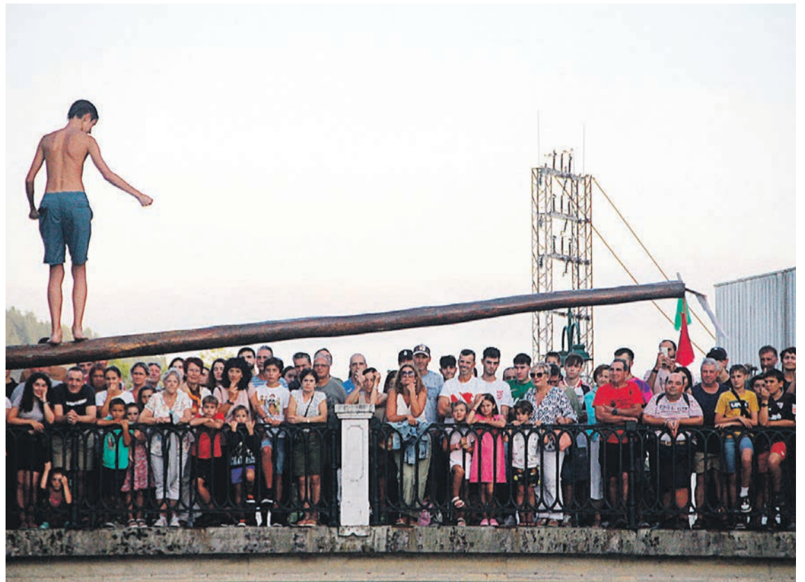
Iazko Kukaña Txapelketak ere jendetza erakarri zuen Errenteriko zubi inguruetara. MIKEL REINA BARROS