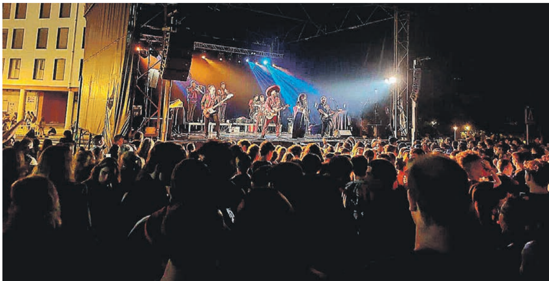
Iaz Los Zopilotes Txirriaos taldeak zelaia jendez bete zuen. LURGORRIKO JAI BATZORDEA

Ibilbide luze eta oparoko musikariek hartuko dute Lurgorriko zelaia San Lorentzo Egunean. Eskualdeko The Uski's taldeak emango dio hasiera gauari, eta ostean, Esne Beltzako txanda izango da, agur biran Gernika-Lumon geldialdia eginez.