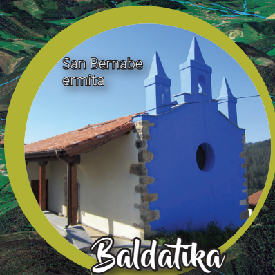
San Bernabe ermita