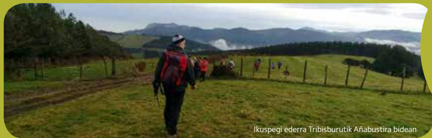
Ikuspegi ederra Tribisburutik Añabustira bidean